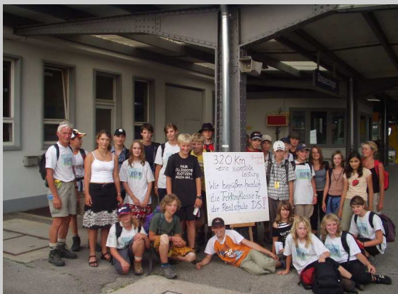
Zielankunft Trekkingklasse 2006

Die Trekkingklasse besteht aus Schülerinnen und Schülern, die sich gegen Ende des sechsten Schuljahres um die Aufnahme in eben diese beworben haben. Ihr Ziel besteht vordergründig darin, am Ende des siebten Schuljahres im Verlauf einer sechzehntägigen Wanderung die Strecke von Pforzheim nach Basel (mehr oder weniger entlang des Westweges) zu Fuß zurückzulegen. Im Zuge der Neubildung der siebten Klassen entsteht hier-