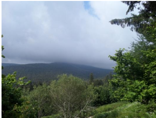
Wetter bevor es losging.