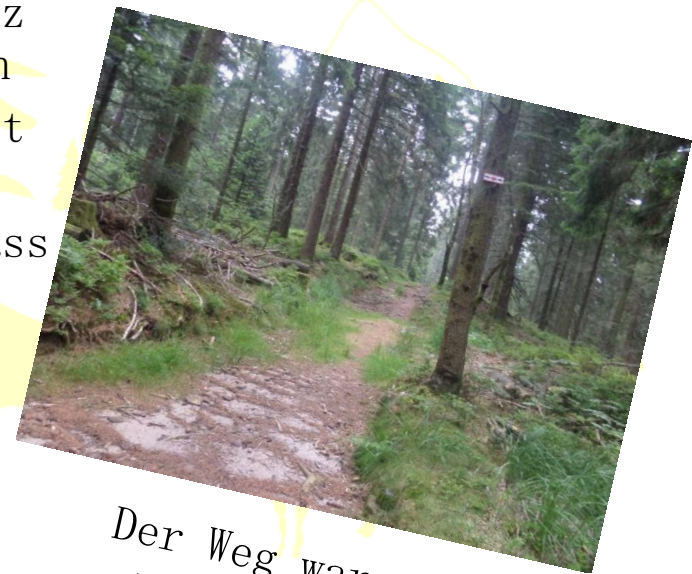
Der Weg war steinig und mit vielen Wurzeln bedeckt