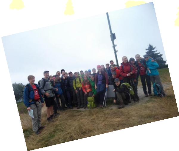
Von Badner Höhe zur Darmstädter Hütte

Der erste Anstieg war dann ungefähr nach einer halben Stunde auf den Hochkopf. Als wir oben angekommen sind, hat uns eine schöne Aussicht erwartet. Der Wind dort oben auf 1160 m war ganz schön kalt, wir durften auch keinen Müll liegen lassen, denn dort oben war ein Naturschutzgebiet (mache ich ja aber eh nie - haha). Ich habe euch vorhin extra ein Bild gemacht, dass ihr so eine grobe Vorstellung habt.