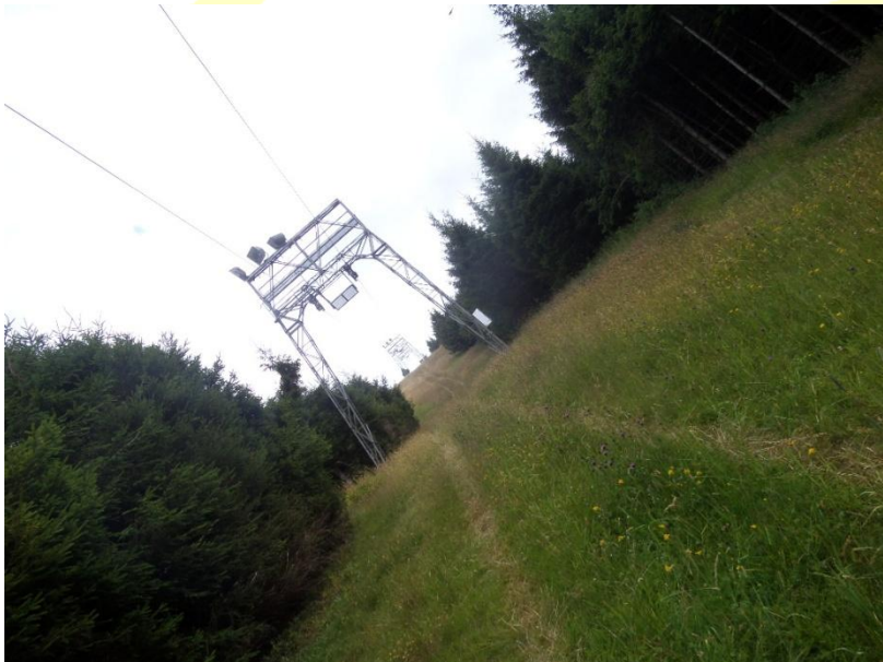
Von Badner Höhe zur Darmstädter Hütte

Auf der nächsten Seite könnt ihr euch noch anschauen wie das Wetter und die Wege waren.