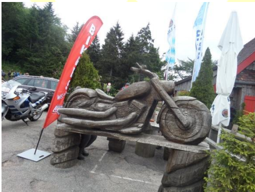
Vor der Bikerkneipe

Danach sind wir zum Mummelsee und zur Hornisgrinde nochmal ein ganzes Stück hoch gelaufen. Dazu erzähle ich euch auf der nächsten Seite mehr.