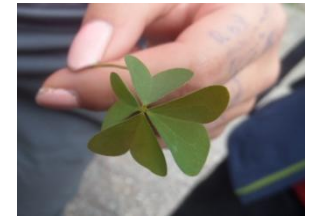
Glücksbringer am Wegesrand

Zwischendurch kamen sogar mal kurz ein paar Sonnenstrahlen durch.