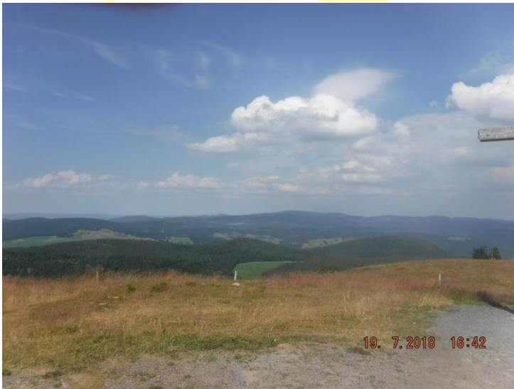
Etappe 13 von Berghotel Jägermatt nach Wanderheim Belchenblick

Das Wetter war drückend warm und an hohen Stellen wehte ein kalter Wind.