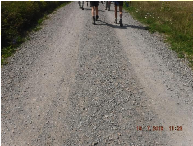
Etappe 13 von Berghotel Jägermatt nach Wanderheim Belchenblick

Es gab verschiedene Wege. Die meiste Zeit, abgesehen vom Belchen und dessen Abstieg, waren Kieselwege. Die Wege auf den Belchen (1414m) waren schmale, steile Pfade.