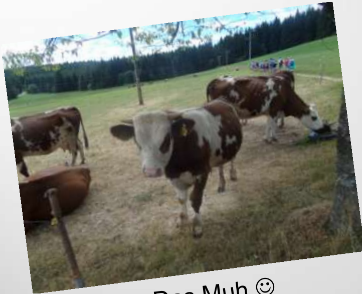
Das Muh ☺