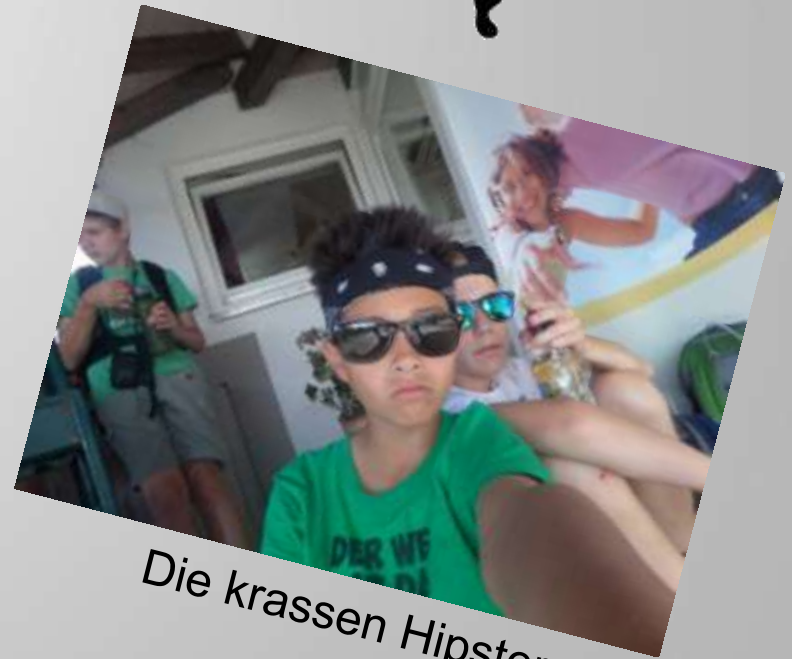
Die krassen Hipster