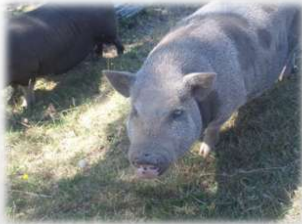
Das Schwein 😊