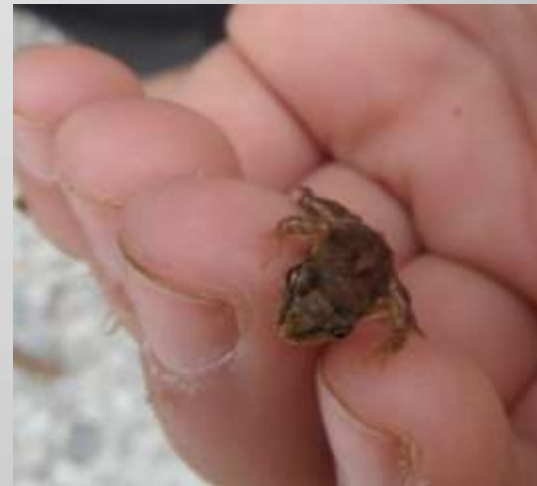
ein Baby Frosch