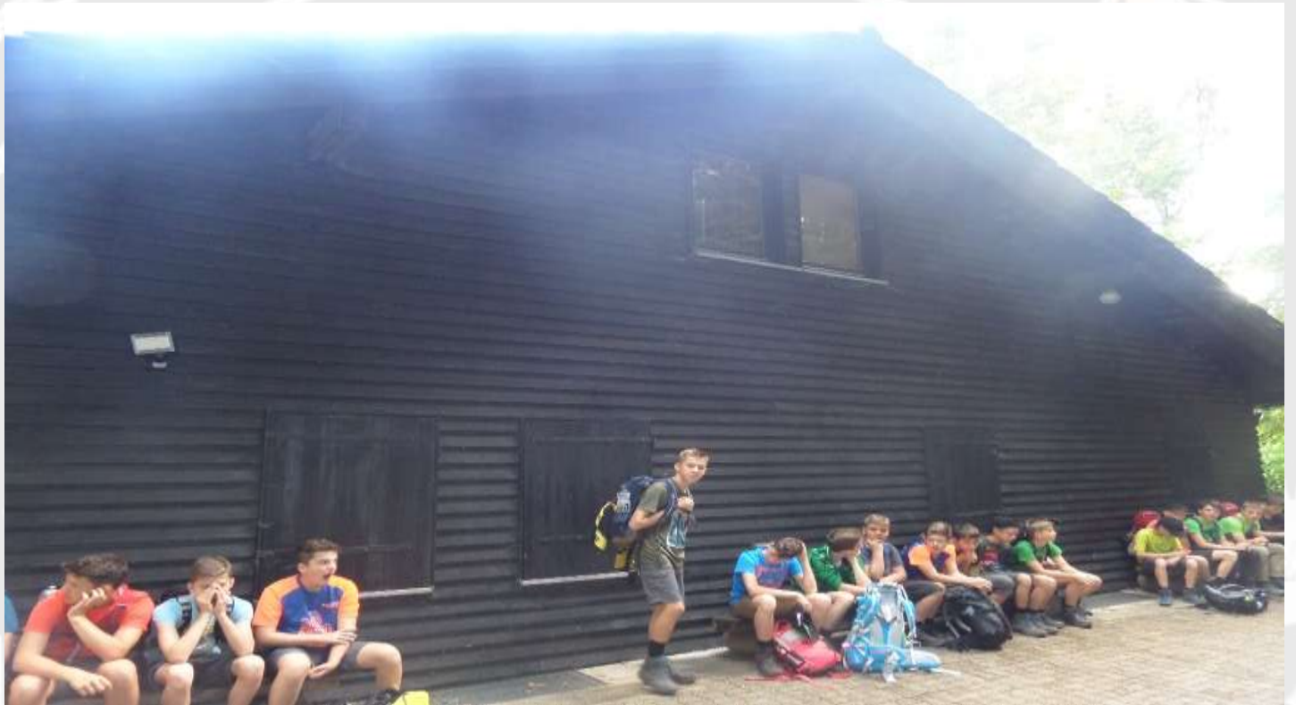
Etappe 4: Von Bermersbach zum Ochsenstall