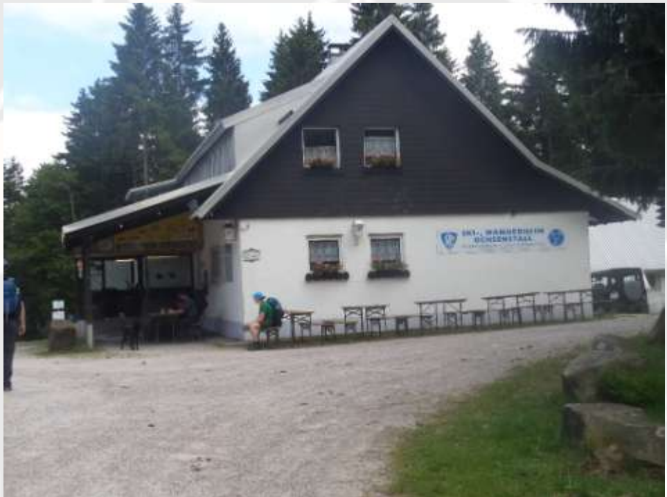
Etappe 4: Von Bermersbach zum Ochsenstall

Unser Tagesziel nach langer Anstrengung: Hier gab es leckeres Abendessen und schöne Zimmer.