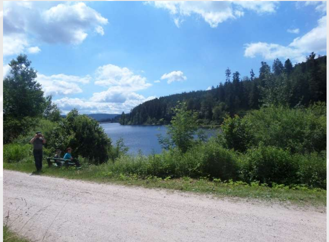
Etappe 4: Von Bermersbach zum Ochsenstall

Als wir die nächste Pause gemacht haben, waren wir an der Schwarzenbachtalsperre. Die letzte Pause machten wir in Sand.