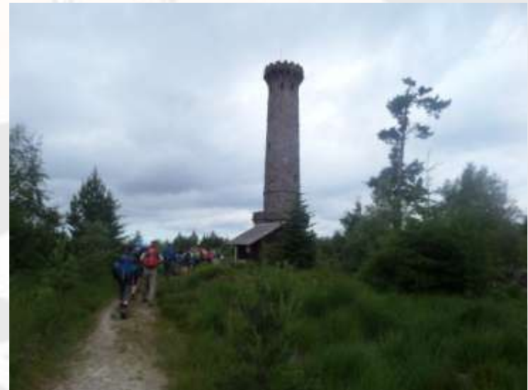
Etappe 4: Von Bermersbach zum Ochsenstall

Zuerst sind wir an Forbach vorbeigekommen. Danach sind wir steile, anstrengende Steinwege hochgewandert, bis wir an der Badener Höhe angekommen sind. Dort haben wir unsere erste Pause gemacht.