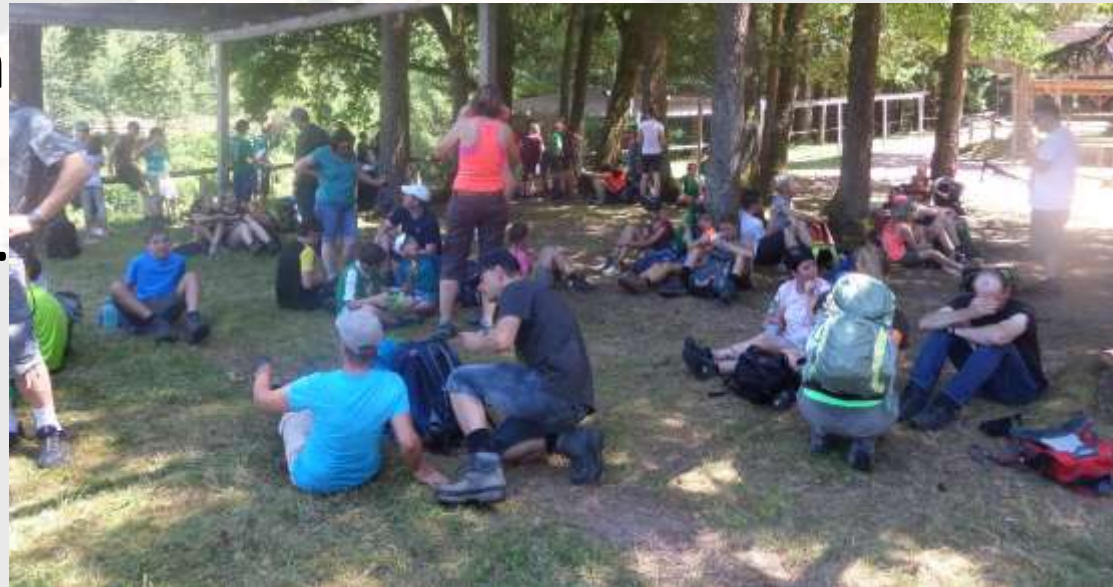
Etappe 9: Vom Hornberger Bahnhof zur DJH Triberg

Grüße an euch! Schön, dass ihr mitgewandert seid!