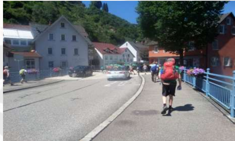
Etappe 9: Vom Hornberger Bahnhof zur DJH Triberg

Als wir dann vollzählig waren, ging es mit dem Zug nach Hornberg. Im Zug trafen wir dann weiter Familienmitglieder. Als wir in Hornberg ankamen, waren dort auch die restlichen Personen.