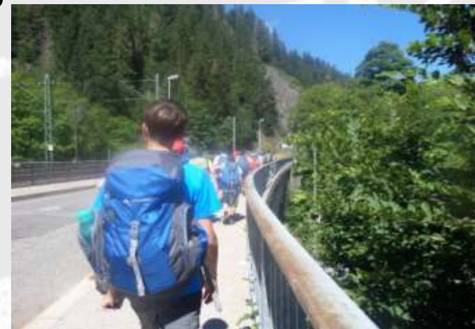
Etappe 9: Vom Hornberger Bahnhof zur DJH Triberg

Als wir dann alle fertig gegessen hatten und alle gerichtet waren, ging es auch schon zum Triberger Bahnhof. Der Weg bis dort hin ging 3 Km durch die Stadt, dort waren sehr viele Touristen. Am Bahnhof trafen wir schon die ersten Familienmitglieder und Freunde.