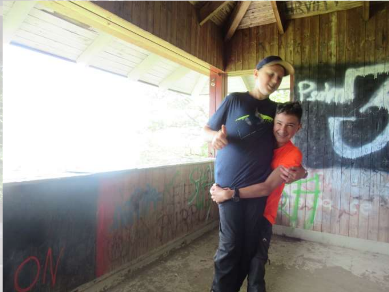
18. Trekkingklasse der Realschule Donaueschingen