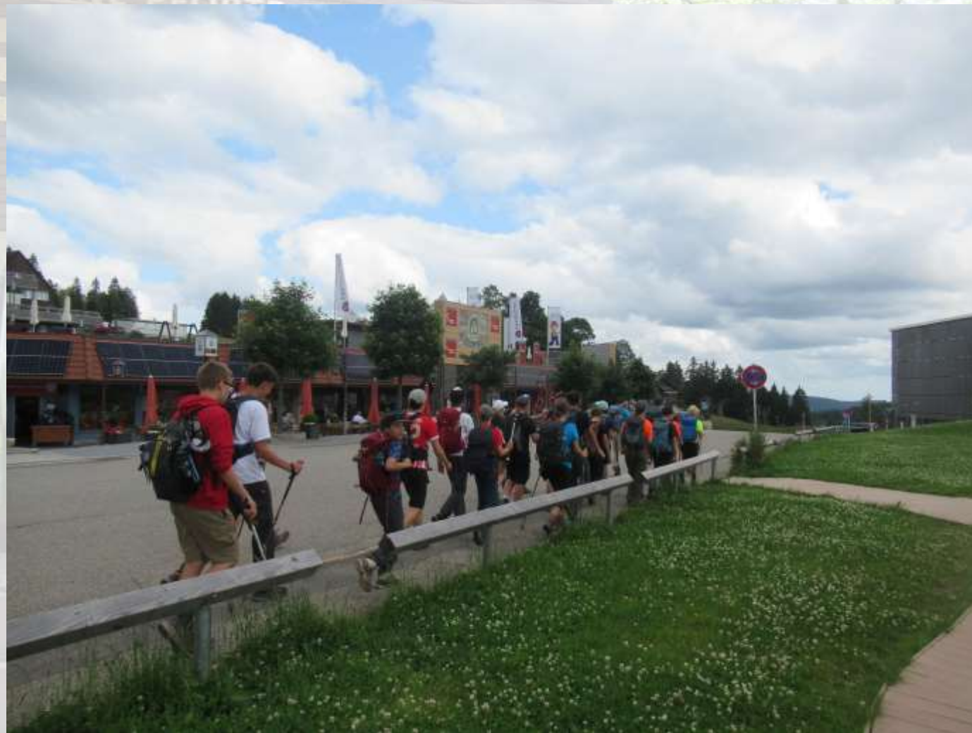
18. Trekkingklasse der Realschule Donaueschingen