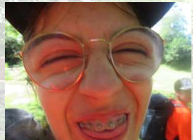
18. Trekkingklasse der Realschule Donaueschingen